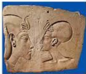
Faraones Akenatón y Nefertiti